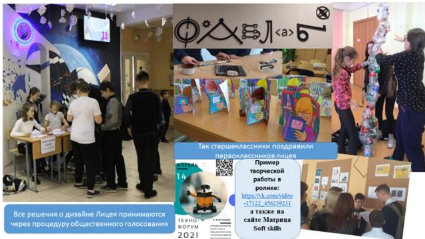
Фото документы, иллюстрирующие воспитательную работу в лицее при участии родителей обучающихся

В Лицее работают 2 Музея с постоянными экспозициями: